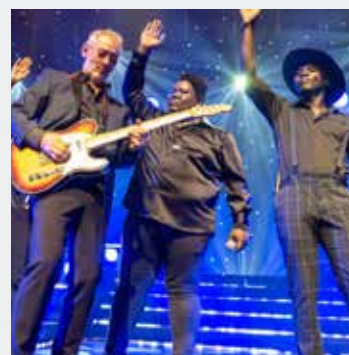
L'HÉRITAGE GOLDMAN SAMEDI 4 MAI 20H30 PLACES PAYANTES