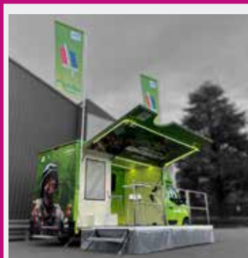
PODIUM ARMÉE SAMEDI & DIMANCHE