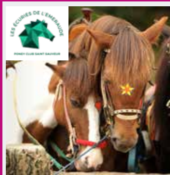
BALADES À PONEYS