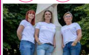
DIM. 5 MAI - MARCHÉ DÉPART 9H DE LA FOIRE