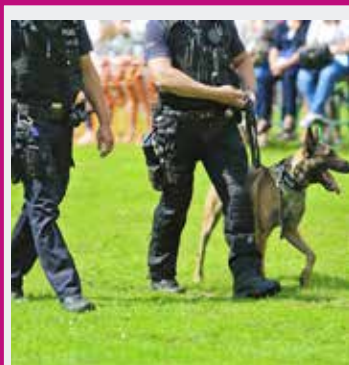
BRIGADE CANINE VEND. 3 MAI 11H & 15H