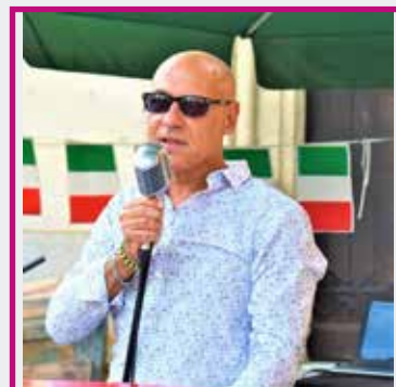
CHANTEUR ITALIEN VENDREDI & SAMEDI MIDI ET SOIR DANS LE CHAPITEAU VILLAGE GOURMAND