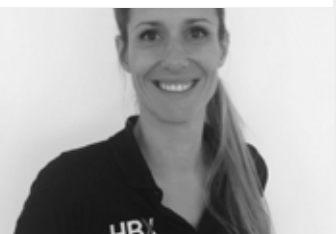
MASSAGES & DEMOS TOUS LES JOURS