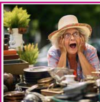
ALLÉE DES BROCANTEURS + DE 60 MÈTRES D'EXPOSITION