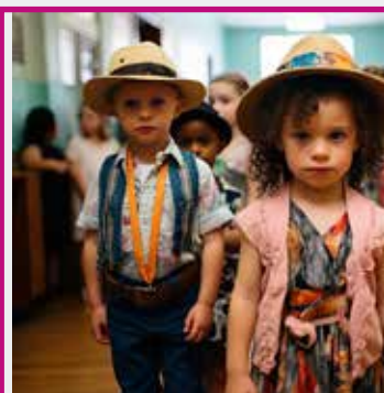
DÉFILÉ AVEC LES COMMERCANTS DU CENTRE VILLE DIMANCHE 15H