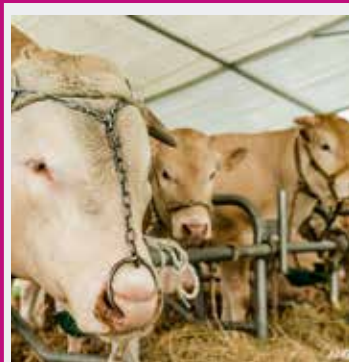
FERME EXPO & ANIMATIONS