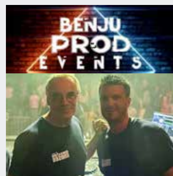
SOIRÉE DJ SAMEDI 4 MAI 23H00 GRATUIT