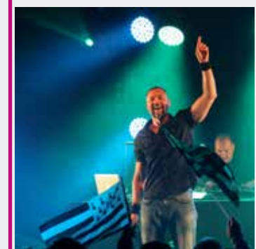
MANAU VENDREDI 3 MAI 20H30 PLACES PAYANTES