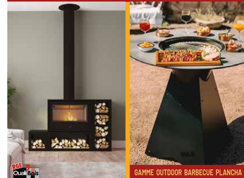
GAMME OUTDOOR BARBECUE PLANCHA

VENTE & INSTALLATION POÊLES à BOIS et GRANULÉS • CHEMINÉES • INSERTS