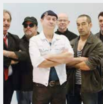
SOLDAT LOUIS VENDREDI 3 MAI 22H00 PLACES PAYANTES