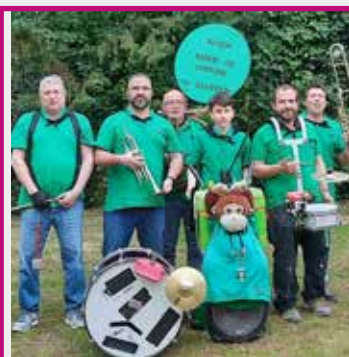
BANDAS BANDE DE COPAINS DIMANCHE 11H > 15H